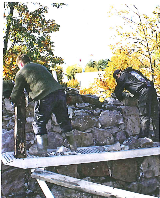
Restaurering av karantenemuren.