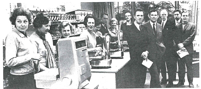
Dette bildet er ikke lærerstaben ved Handelsgymnasiet, det kunne godt ha vært det, men de som tok avgangseksamen ved Kristiansand Handelsgymnasium før jul 1945. 25 år etter kom de sammen igjen for å minnes den ekstraordinære situasjon de kom opp i som elever høsten 1944 og våren 1945. Lærerne ble arrestert og det ble streik ved skolen. Her er 25-årsjubilantene fotografert i den nye skolens undervisningslokaler.

«Det toårige handelsgymnasium må fortsatt beholde karakter av en avsluttende fagskole», heter det i styrets konklusjon. —