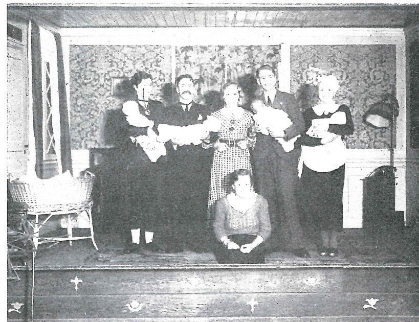
Elevenes eget teater Hermes har forlystet tusener av kristiansdendere gjennom årene. Teatret har gjennomlevet skiftende tider, men særlig i 30-årene gikk mang en festlig forestilling over scenen med unge og iherdige aktører. Dette bildet er fra 1935 da «Storken kommer» stod på programmet.

Nå skal vi ikke uten videre beskyldte kommunen for å ville spise av annen manns grautfat. Det var virkelig tunge tider, noe som kom til å avspeile seg flere ganger i Handelsgymnasiets historie. Så sent som i 1927 foreligger der en bemerkning fra finansutvalget, der det heter at skolen er blitt «en for kommunen uforholdsmessig kostbar institusjon». I den anledning ble det fra styrets side iverksatt en undersøkelse som munnet ut i en sammenligning mellom utgiftene pr. elev ved samtlige skoler i byen. — Handelsskolen bunnet statistikken med under sytti kr. pr. elev. For Handelsgymnasiets vedkommende var tallet 262,70 kroner —