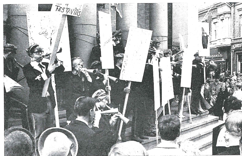
Blårussen har gjort seg sterkt gjeldende i byens russeløyer gjennom årene. Hver 17. mai besetter blårussen Privatbankens trapp, og formannen holder refselsestale til alt folket, godt assistert av plakater og trompeter.

Uten å gå i detaljer, kan man vel trygt si at der er en klar