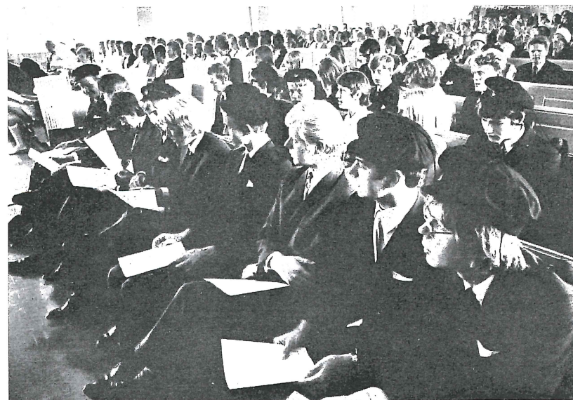
Hvert år er det eksamenshøytidelighet med utdeling av vitnesbyrd. Her sitter studentene fra økonomisk gymnas med sine papirer.

Men noe skjedde der da. Østre Strandgate 17 A ble ombygget