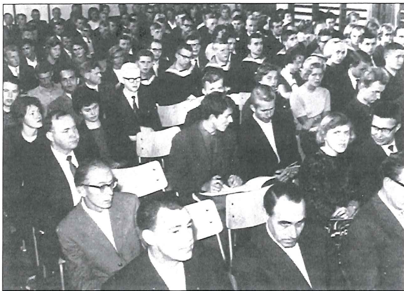
Fra den første filosofiforelesning i Kristiansand (Katedralskolens gymnastikksal) 10/9 1962

Konkret gjaldt det katedralskolens og museets alltid levende byggeplaner, og mer visjonært: lokaliseringen av det framtidige universitet. Det var stort at det etter hvert ble bygging for alle på Gimle, ikke for katedralskolen på Grim, som han først hadde tenkt seg. Denne hans hovedplattform og første kjærlighet, hans Schola Christiansandensis, var fra først av kalt "byens didaktiske institutt": Fattigskole, borgerskole og latinskole i ett. Den var der jo allerede fra ca 1650 da det bare var 50 hus i byen!