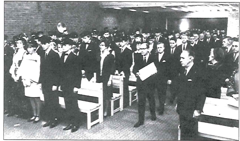
Fra en innmatkulering i Frikirken